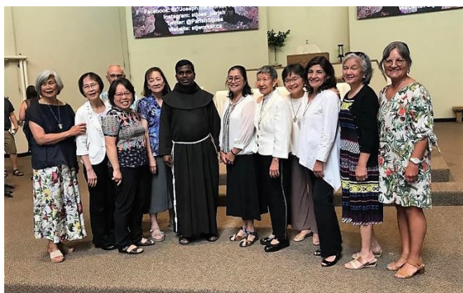
Trois engagements permanents à la fraternité St Anthony of Padua, Richmond, CB 6 août, 2023