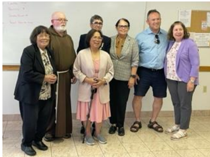
Nouveau conseil pour la fraternité St. Felix, Toronto, ON, septembre 2023