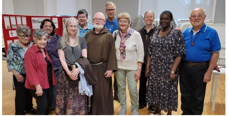
Barbeque franciscain avec les frères mineurs à Mt. St Francis Retreat Centre, Cochrane, Alberta