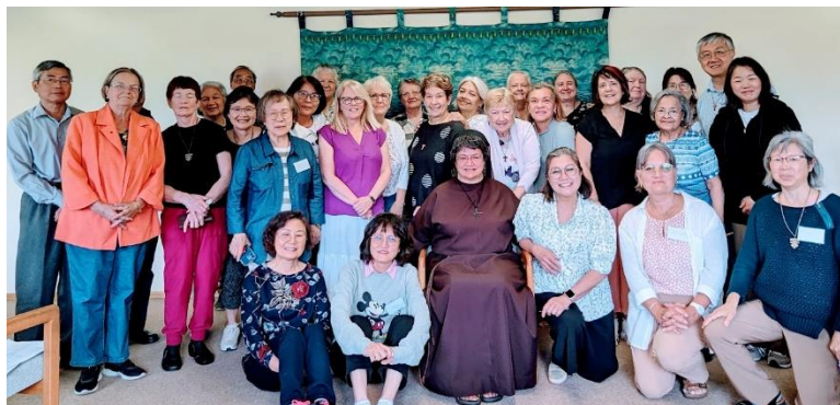
Retraite à l'Abbé en Mission, CB le 6 juin, 2023