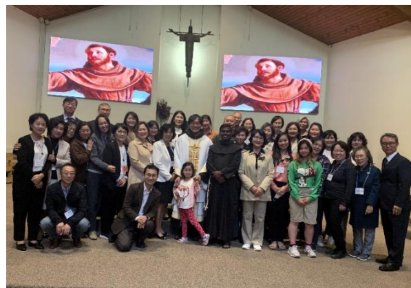
Quatre engagements permanents à la fraternité à la St. Francis of Assisi, Surrey, CB le 23 septembre, 2023