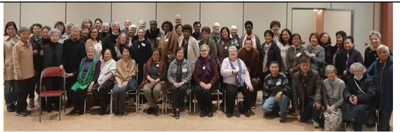
6 avril, Retraite dans la région de Québec : Un moment spirituellement enrichissant pour toutes nos sœurs et tous nos frères de la Fraternité régionale de l'Est du Canada qui ont pu y participer !

L'événement à l'église Saint-Kevin a également été l'occasion de dire au revoir au père Pierre Charland (anciennement provincial de la province du Saint-Esprit, frères OFM) avant son départ pour Baie-Comeau, au Québec, où il sera installé comme nouvel évêque.