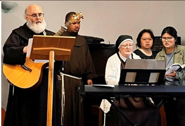
Musiciens pendant une liturgie au Fête des tentes au camp Our Lady of Victory à Bentley, en Alberta. Ce fut un week-end de fraternité, de jeux, de prière, d'adoration, de la messe, de réconciliation et de conférences.