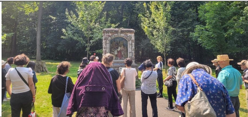
2 août : Le groupe a prié le chemin de croix dans l'enceinte du sanctuaire des frères capucins dédié à la réparation du Sacré-Cœur et à saint Padre Pio.