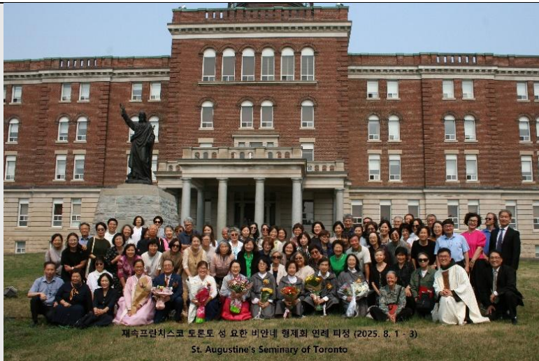
제수프린치스코 토론토 성 요한 비안네 형제회 연례 피정 (2025. 8. 1 - 3) St. Augustine's Seminary of Toronto