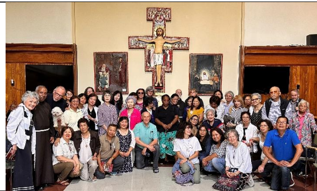
Les membres des régions du Québec et de l'Est de l'Ontario de la Fraternité régionale Eastern du Canada célèbrent ensemble la fête de la Portioncule le 2 août 2025.