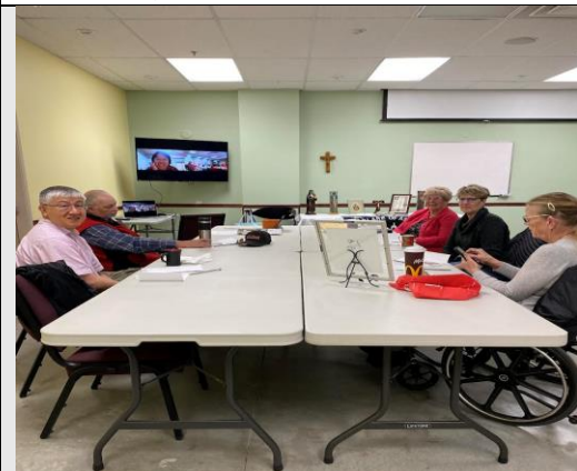
800e centenaire de la fête des stigmates de saint François d'Assise, Fraternité Sainte-Claire, Coquitlam, BC