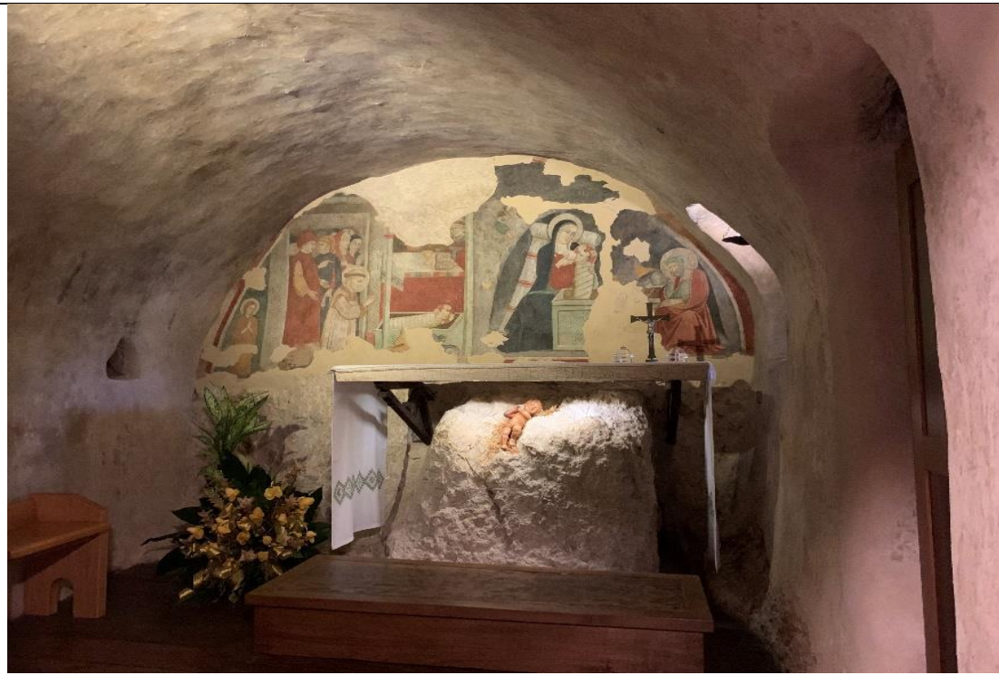
à Greccio, Italie