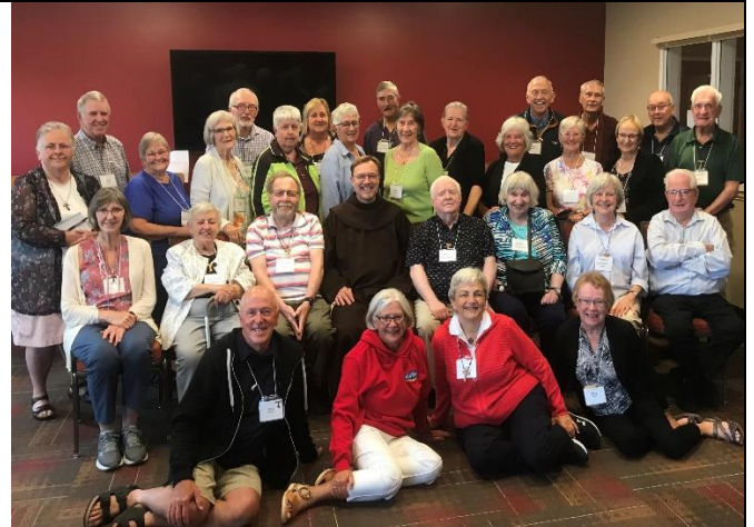
Fraternité St. Francis of Assisi Retraite sept. '24