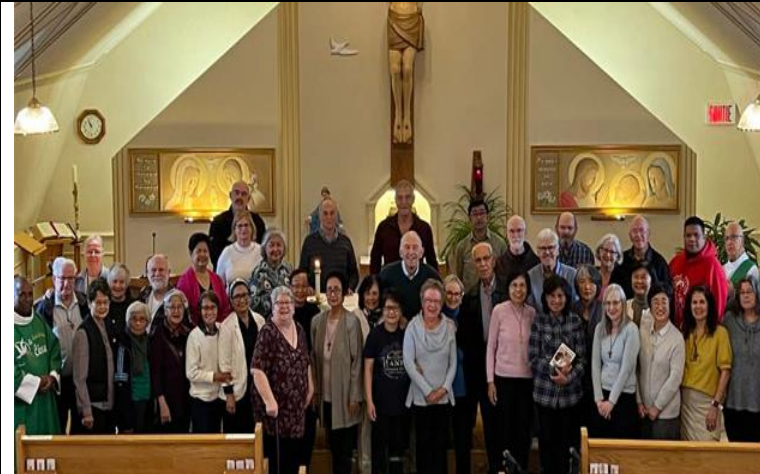
Rég. de Eastern- Atelier de développement du leadership 24 octobre