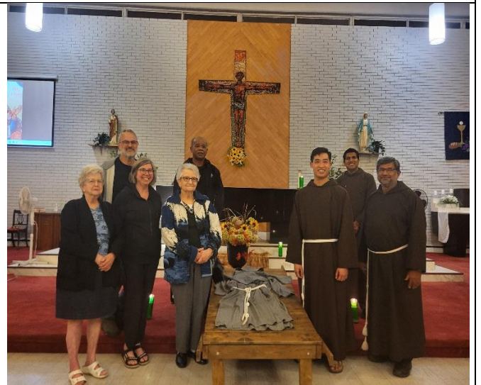
Fraternité de St. François d'Assise, Ottawa, Transitus