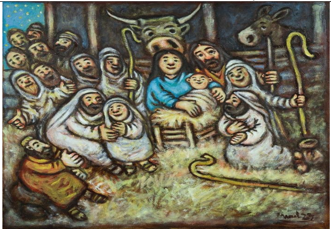
Huile sur toile de Marcel Morin-Adoration des bergers