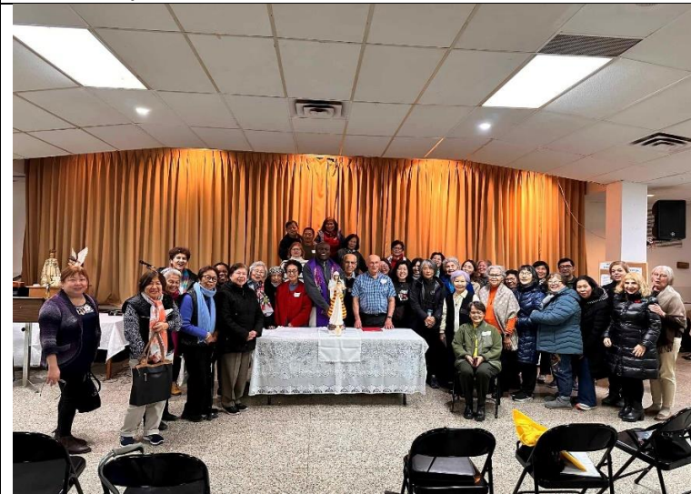
Journée annuelle de recueillement dans la région de Montréal, 24 nov.